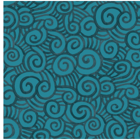
TUMULTE Orage 123 Motif d'impression