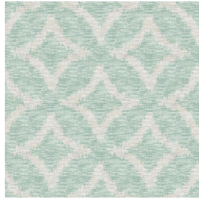
6029 Amande 75 Motif d'impression