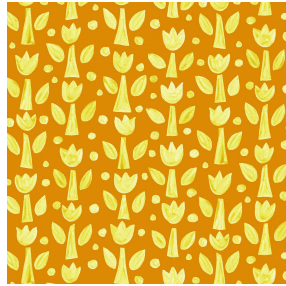
TULIPE Soleil 127 Motif d'impression