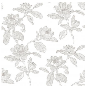
PAEONIA Titanium 98