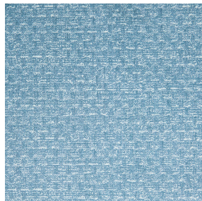
RUSTIC Glacier 43 Motif d'impression