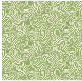
NAOMI Prairie 125 Motif d'impression