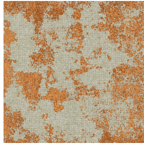
SIERRA chaudron 118 Motif d'impression