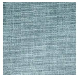
MUNA Ardoise 87