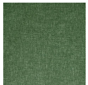
MUNA Lierre 124