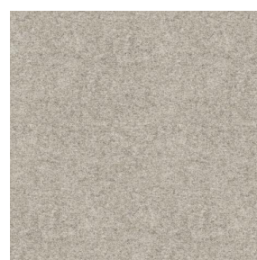
ELAINA Naturel 26