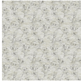
6049 Naturel 26 Motif d'impression