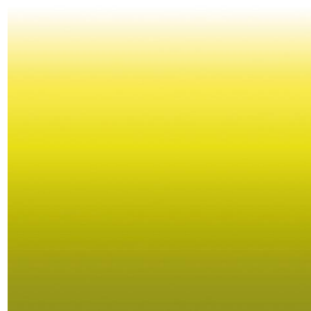
ZADIG Anis 62