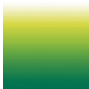
ZADIG Cactus 36