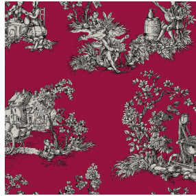
ZELIE Rubis 59 Motif d'impression