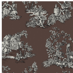
ZELIE Taupe 95 Motif d'impression