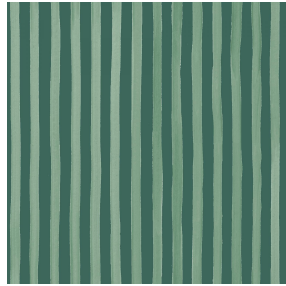
SONG Sapin 126 Motif d'impression