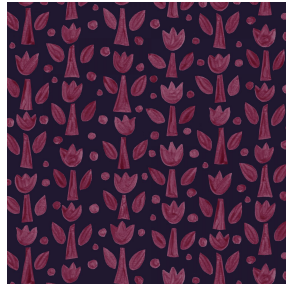
TULIPE Bordeaux 04 Motif d'impression