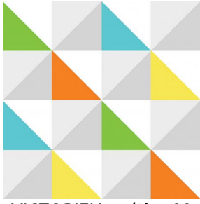
VICTORIEN multico 98