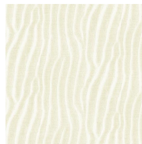
SABLE Ivoire 115