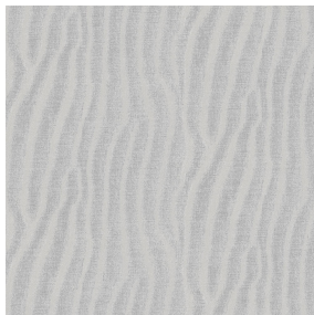
SABLE Souris 31 Motif d'impression