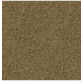
ELAINA Chamois 111 Motif d'impression