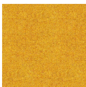
ELAINA Genêt 06