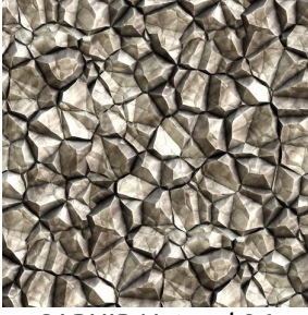
SAPHIR Naturel 26