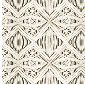
PETULA Naturel 26 Motif d'impression