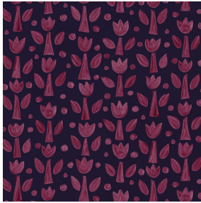
TULIPE Bordeaux 04 Motif d'impression