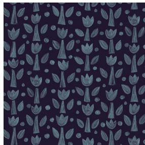
TULIPE Nuit 128