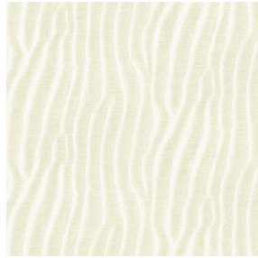
SABLE Ivoire 115 Motif d'impression