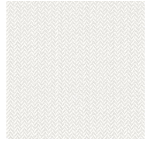
SCOURTIN Blanc 01