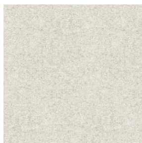
ELAINA Ivoire 115