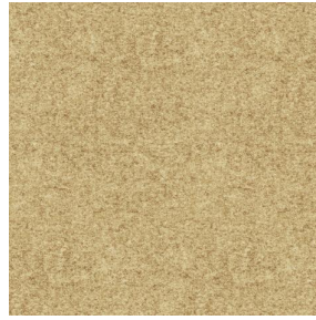
ELAINA Beige 63