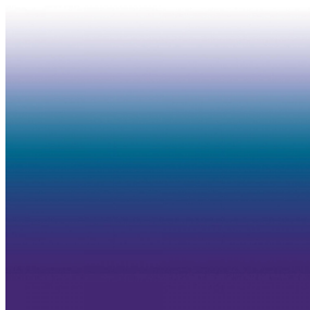
ZADIG Bleu 41 Motif d'impression