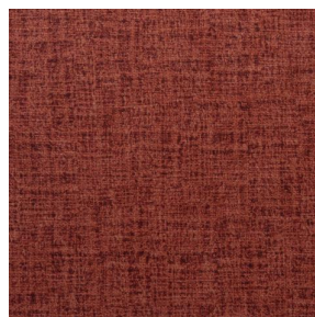
MURA GRENAT 56