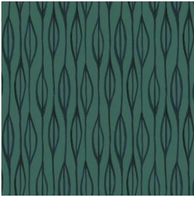
YENDI Sapin 126