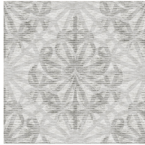
6034 Gris 97 Motif d'impression