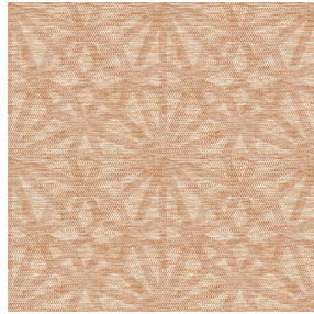
6039 Caramel 174 Motif d'impression