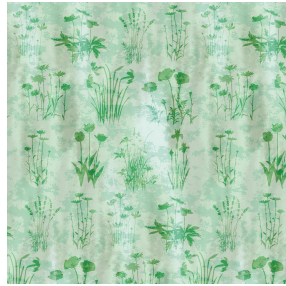
6052 Vert 24 Motif d'impression