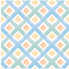
ARIA Multico 98 Motif d'impression