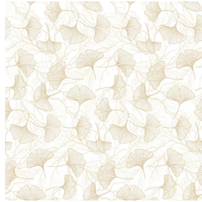
6060 Naturel 26 Motif d'impression