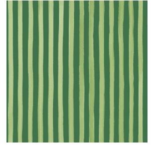
SONG Lierre 124