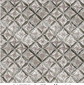
PIETRO Ficelle 09