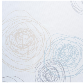
NAHIA OR 94 Motif d'impression