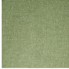
MUNA Tilleul 103 Motif d'impression