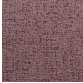
MURA ROSE 129 Motif d'impression