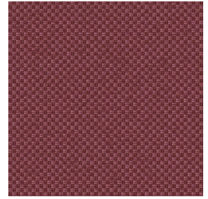
CHARLOTTE Chaudron 118