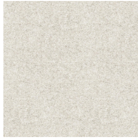
ELAINA Ivoire 115 Motif d'impression