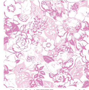
CHARMETTE rose 129