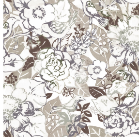
CHARMETTE Taupe 95 Motif d'impression