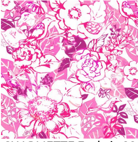
CHARMETTE Fuchsia 33