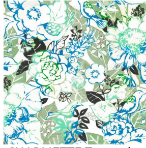
CHARMETTE Turquoise 53