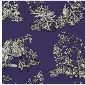
ZELIE Prune 84 Motif d'impression