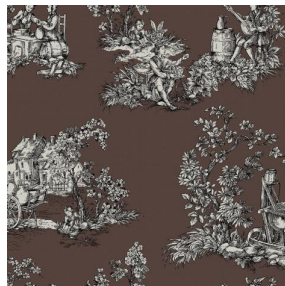
ZELIE Taupe 95