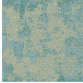
SIERRA brume 47 Motif d'impression