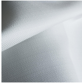
FUNNY bpi 00 Support d'impression