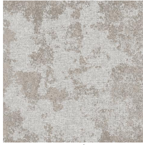
SIERRA ardoise 87