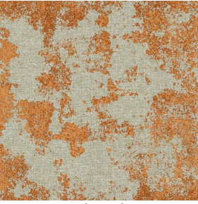
SIERRA chaudron 118