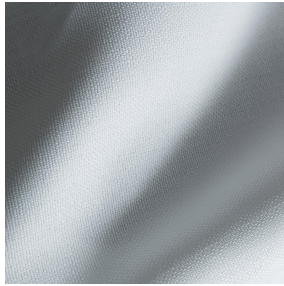
HAVANE bpi 00 Support d'impression