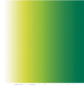
ZENITH Cactus 36