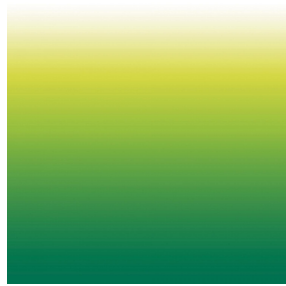
ZADIG Cactus 36 Motif d'impression