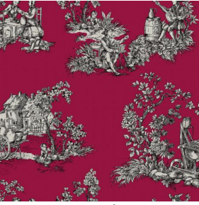
ZELIE Rubis 59