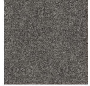
ELAINA Anthracite 38